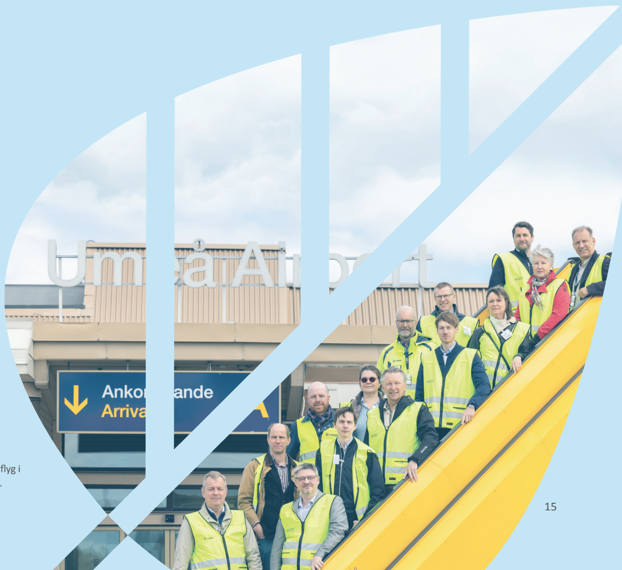
Projektgruppen i Fossilfritt flyg i norra Sverige, 17 maj 2022.

Vi har beskrivit de teknikspår som är aktuella för det fossilfria flyget. Det finns lösningar som är tillgängliga redan nu, medan andra behöver mer utveckling och teknisk mognad. Många hinder återstår att lösa, men med det sagt, möjligheterna är stora och viktiga för att klara flygets gröna omställning. Samarbete krävs på flera nivåer, från den lokala upp till den globala. Norra Sverige har på senare år tagit initiativ och ledarskap på flera områden inom den fossilfria omställningen, och bör göra så även inom det fossilfria flygets utveckling både vad gäller nya flyglinjer, tillverkning inom hållbart flygbränsle samt inom nödvändig infrastruktur.